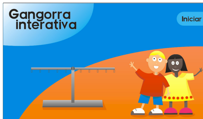
Figura 1. Tela Inicial do OA Gangorra Interativa

O Gangorra Interativa é um objeto de aprendizagem intuitivo que faz a simulação de uma gangorra de pesos que as crianças costumam usar em parque de diversão (Figura 1). O objetivo deste OA é fazer com que os alunos equilibrem pesos em cada um dos lados da gangorra [Sales, 2006].